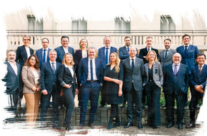
Simon Associés, une équipe réunie autour de valeurs communes*

J.-C. et F.-L. S. : Oui, car nous sommes depuis longtemps acteurs de la transformation numérique de la profession. Nous avons développé nous-mêmes des outils tels que Mission RGPD, pour la gestion des données nominatives, LCM (Legal Client Management) et SimonAcademy, offrant une doctrine toujours à jour. Notre prochain projet est une plateforme qui mettra en relation les avocats indépendants avec leurs clients, une solution originale, jamais rencontrée. Ce travail est aussi pour nous le moyen de garantir la relation fluide, transparente et efficace qui est l'empreinte que nous portons ■