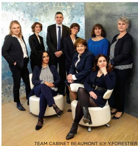
TEAM CABINET BEAUMONT